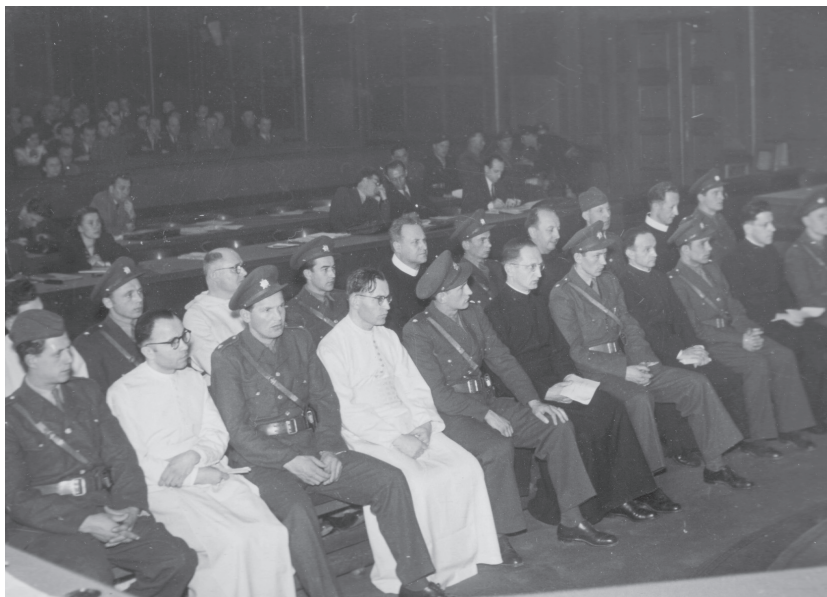
Pohľad na súdených rehoľníkov sediacych na lavici obžalovaných. (NA, f. Ministerstvo Spravedlnosti (nespracované), Klosiův archiv, kr. 243c))