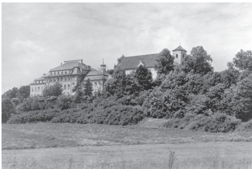
Kláštor redemptoristov v Planej pri Mariánskych Láznach. (ARSH, f. neusporiadané )