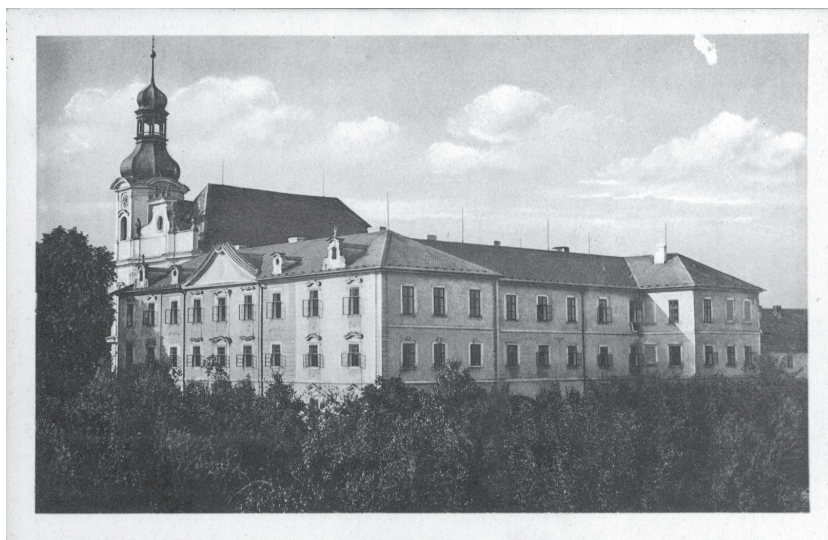
Kláštor redemptoristov v Obořišti pri Dobříši. (ARSH, f. neusporiadané)