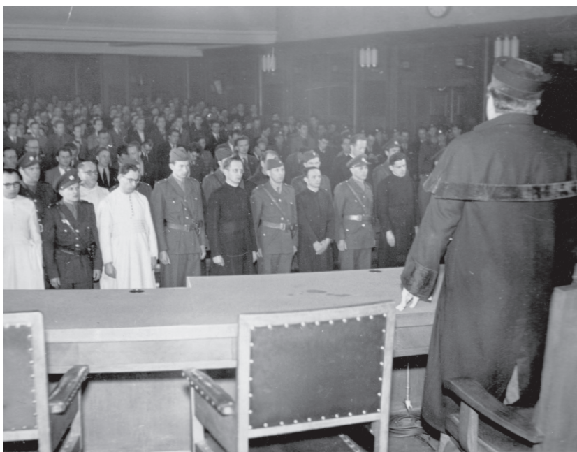
Pohľad na obžalovaných rehoľníkov a zhromaždené obecenstvo v súdnej sieni.